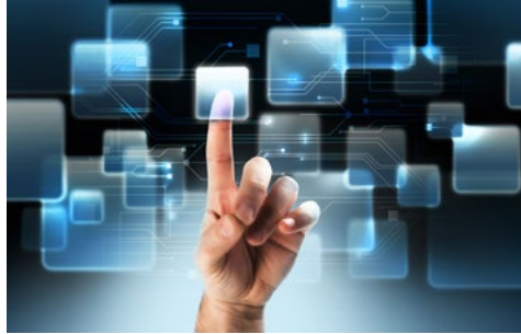
Kreativprozesse zur Entwicklung neuer Geschäftsfelder und Produkte im Klimabereich