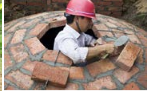
Wir unterstützen Sie bei der Auswahl des passenden Klimaschutzprojektes.